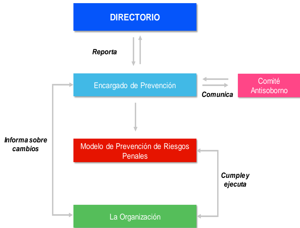
Ilustración 2 - Esquema de funcionamiento del Modelo de Prevención de Riesgos Penales

A continuación, se definen las responsabilidades que tiene cada uno de estos órganos en las distintas etapas del proceso (diseño, operatividad, supervisión y reporting):