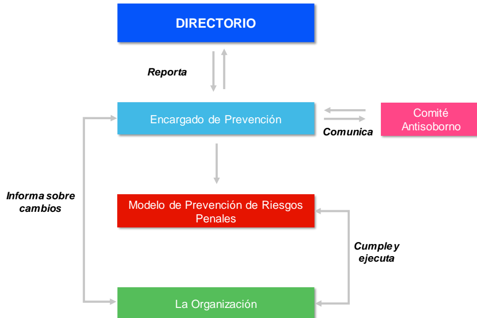
Ilustración 2 - Esquema de funcionamiento del Modelo de Prevención de Riesgos Penales

A continuación, se definen las responsabilidades que tiene cada uno de estos órganos en las distintas etapas del proceso (diseño, operatividad, supervisión y reporting):